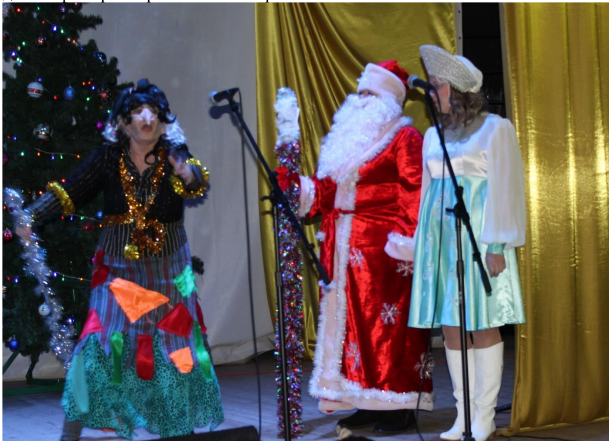
(Конкурс Дедов Морозов и Снегурочек в ЦКиТ рп.Одоев)

Сама часто исполняю роли в театрализованных представлениях, как на мероприятиях ДОО, так и на сцене дома культуры. Тем самым показываю детям пример театрального мастерства.