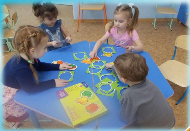
Дидактическая игра «Собираем урожай»