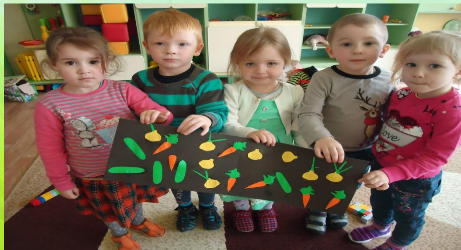
Коллективная работа аппликация «ОВОЩИ на грядке»